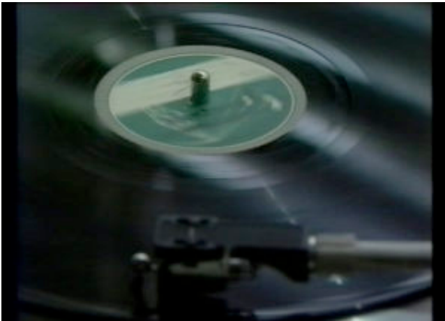
André S. Labarthe, Georges Bataille (Bataille à perte de vue) , France 3, collection « Un siècle d'écrivains », 30 avril 1997

paroles de Queneau, ainsi mises en exergue, acquièrent une résonance particulière et nouent, avec la voix du commentaire diffusée en contrepoint, un dialogue par-delà le temps. Ces procédés de découpage et de collage, consistant pour ainsi dire à sculpter l'image et la parole de l'auteur portraituré, apparaissent comme une manière particulière de faire parler l'archive et de la questionner en se l'appropriant.