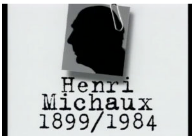
Alain Jaubert, Henri Michaux , France 3, collection « Un siècle d'écrivains », 31 mai 1995